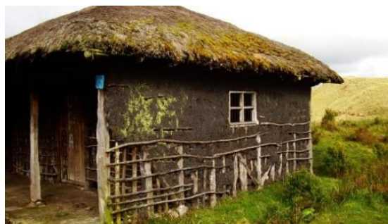
Figura 3. Utilización de cuadrados y ángulos en la construcción de viviendas

Nota: uso del cuadrado y los ángulos de 45^\circ en la construcción de viviendas y estructuras en la comunidad Pasto.